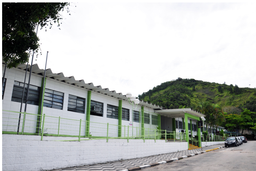
Figura 1 – Campus Centro

O edifício sede localiza-se no campus Centro, na Av. Frei Pacífico Wagner 653, Centro – Caraguatatuba/ SP e compreende, em 2020, 06 salas de aula, Auditório, com capacidade para 260 pessoas, dotado de recursos audiovisuais e refrigeração, laboratório de informática, instalação sanitária e espaço de convivência e alimentação.