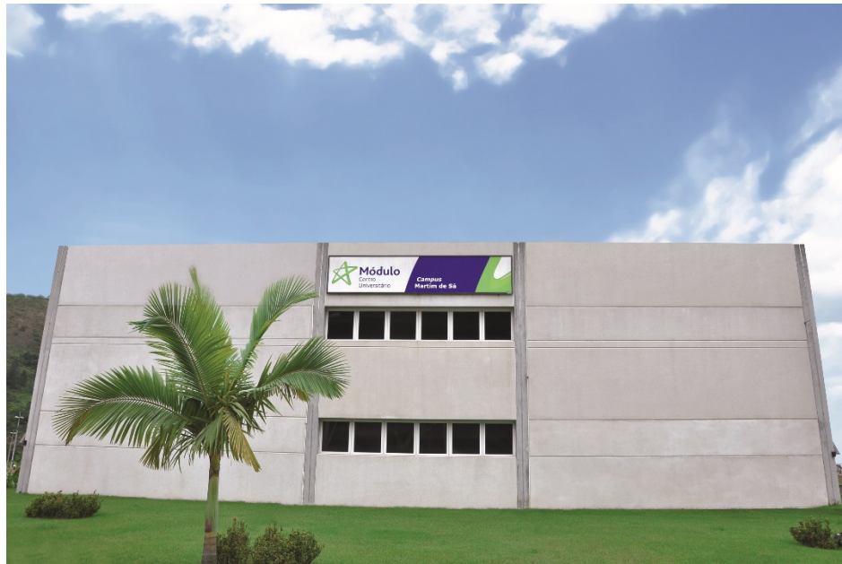
Figura 2 – Campus Martim de Sá

ar, mesa com quinze cadeiras, dois sofás para cinco lugares, bebedouro e janela com ventilação e iluminação natural. Também no Bloco I temos a Sala de coordenação, próxima à dos professores, equipada com mesas com telefone, cadeiras, condicionador de ar, janela com ventilação e iluminação natural, computadores com acesso à internet e impressora. E ainda consta no mesmo bloco a sala da Reitoria com condicionador de ar, com janela e ventilação natural, com mesas, computadores, sofá, sala de reunião e a sala da CPA com mesa, computador, armários, iluminação natural e condicionador de ar. O Bloco II dispõe a Central de Atendimento aos Alunos (CAA), salas de aula, os ateliês, a maquetaria e Brinquedoteca. No Bloco III está localizada a biblioteca além das salas de aula e laboratório multidisciplinar de Ciências Biológicas e Biomedicina, canteiro de obras e laboratório multidisciplinar de Engenharia.