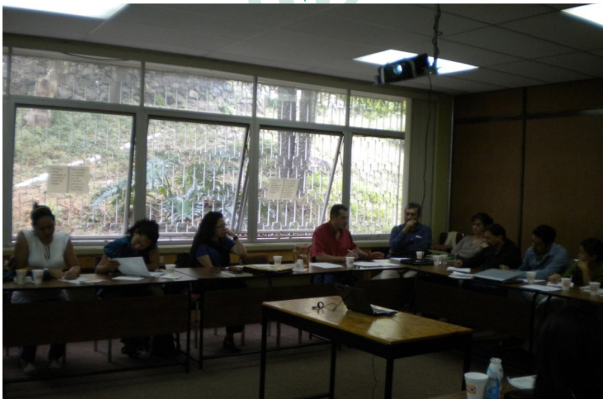
Fotografía 7. Sala de seminarios