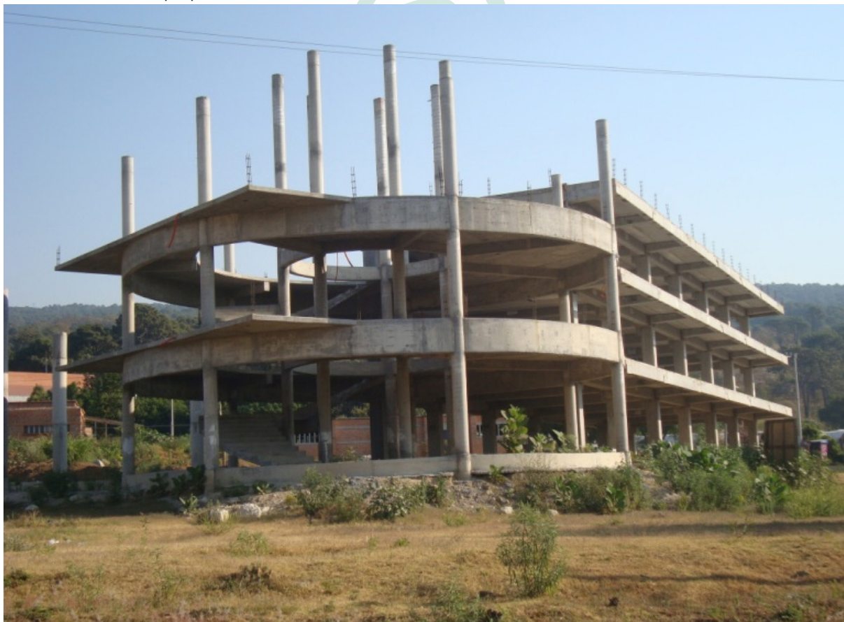
Fotografía 1. Construcción de la Facultad de Ciencias Químicas e Ingeniería