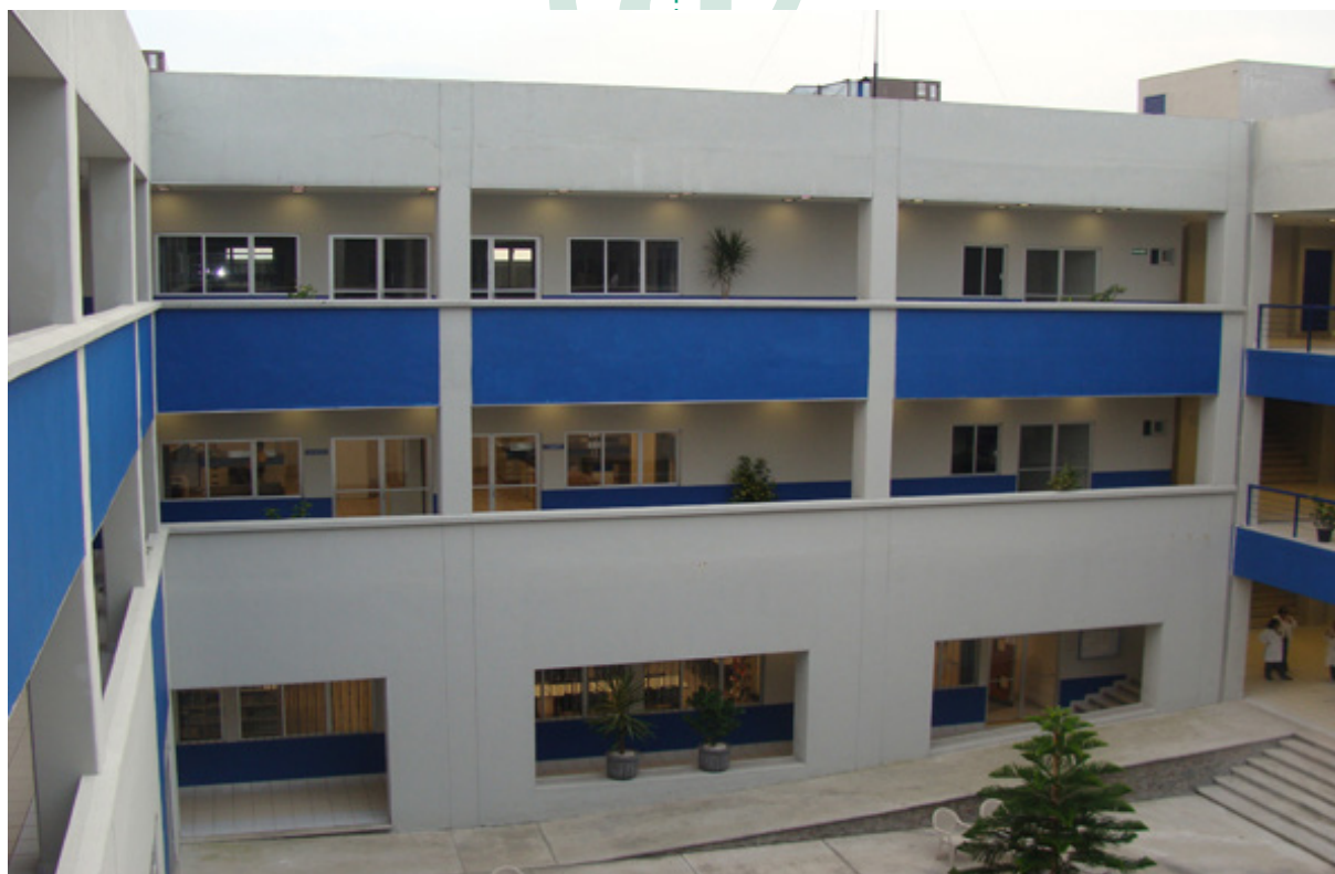
Fotografía 3. Edificios de la Facultad de Medicina