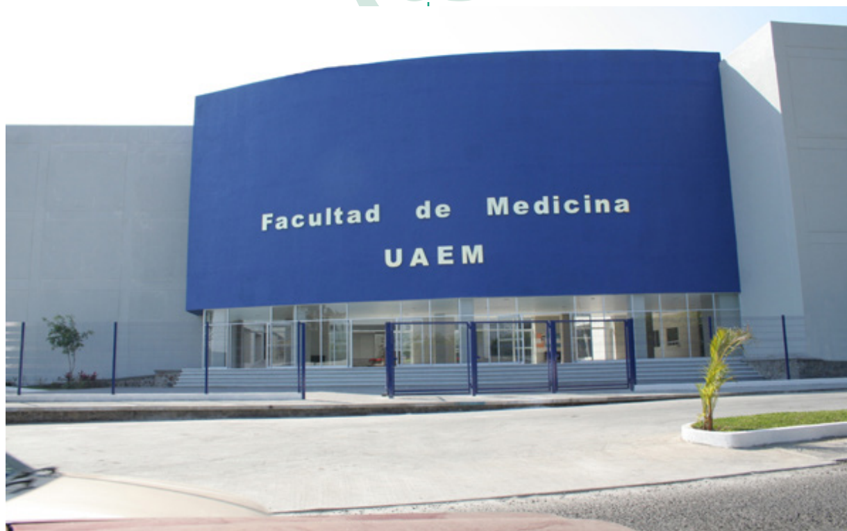
Fotografía 2. Nuevas Instalaciones de la Facultad de Medicina