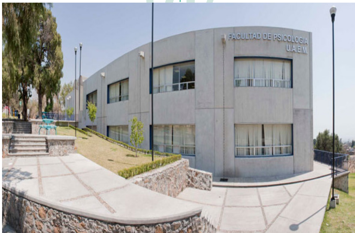
Fotografía 4. Edificio de la Facultad de Psicología

A pesar de este reconocimiento siguen visibles los problemas de espacio, aun contando con una cancha de usos múltiples para ayudar en la prácticas deportivas y académicas de los estudiantes, dentro de