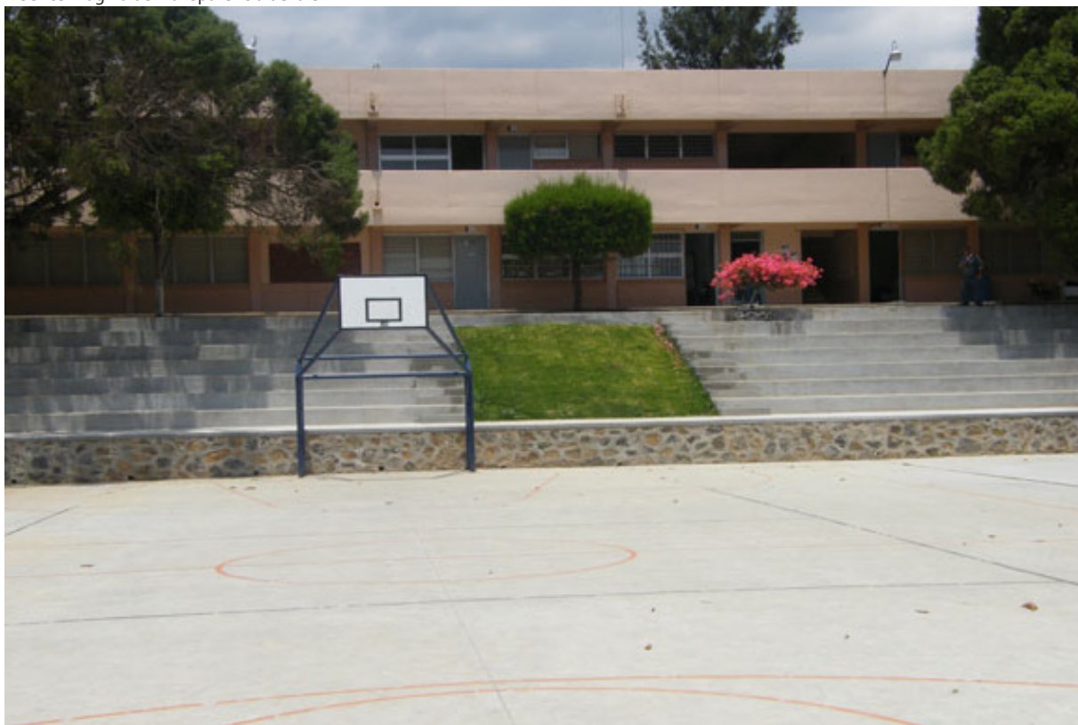
Fotografía 6. Cancha de usos múltiples del ICE