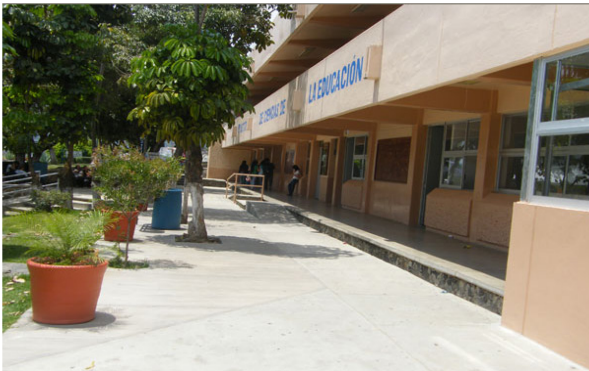
Fotografía 5. Instituto de Ciencias de la Educación

las aulas se encuentran ciertas limitaciones para realizar actividades de docencia, dinámicas de grupos, entre otras actividades que requieran el desplazo de los estudiantes en la misma aula.