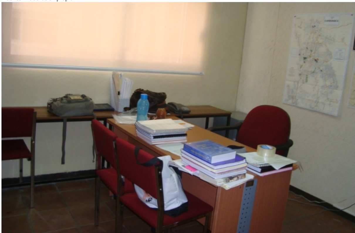
Fotografía 8. Ejemplo de un cubículo

ción entre espíritu de libertad personal y la construcción de relaciones de convivencia social. El clima de aprendizaje, tiene que ser, un ambiente confortable, construido, bajo parámetros ergonómicos, y modelos educativos, que propicien las condiciones para motivar a los alumnos al estudio, al desarrollo personal, al pensamiento crítico, científico, tecnológico y artístico” (Cisne en Revista Digital. Apuntes de Arquitectura, Abril 2011). Sin embargo, en la UAEM hace falta mucho por hacer, para alcanzar estos niveles y crear espacios arquitectónicos diseñados de acuerdo a las necesidades de cada una de las Unidades Académicas que integran la Universidad.